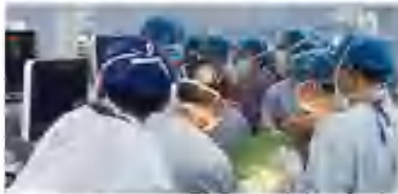
我院心外科团队成功完成我省首例介入二尖瓣腱索修复手术。术中采用微创切口，不用切断瓣膜及传导，也不需体外循环和心脏停跳，利用微创介入系统经心尖穿刺部位

将人工腱索送入心腔内二尖瓣处，在食道超声引导下，将腱索一端与瓣膜固定，后将腱索另一端与心尖固定。患者二尖瓣反流即刻得到控制，超声显示二尖瓣血流完全消失，瓣膜闭合良好，血压稳定，手术取得良好的近期效果，手术操作仅50分钟，患者术后恢复顺利，术后第二天即转入普通病房，复查经中心动静脉导管患者二尖瓣修复良好，手术效果满意！