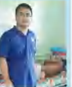
在基里巴斯开展救治工作