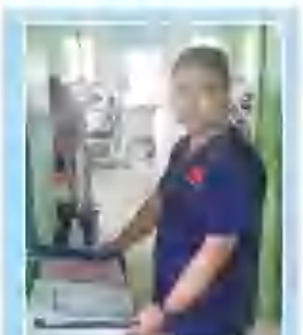
在基里巴斯开展救治工作

中国医疗队的精湛医术和博爱心收到了无数基里巴斯人民的“点赞”,也彰显了不畏艰苦、甘于奉献、救死扶伤、大爱无疆的中国医疗队精神! (人力资源部)