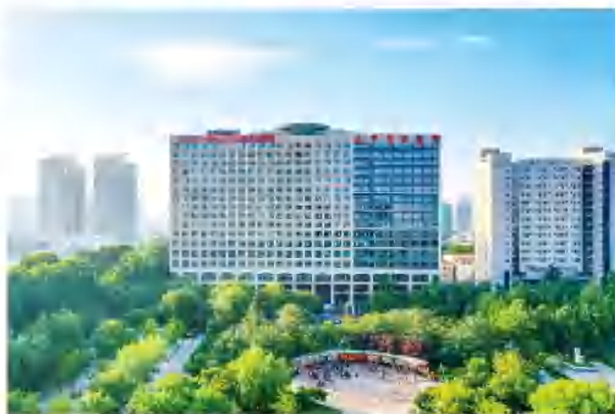
2023年6月，中心院区新病房楼正式投入使用。

坚决贯彻落实党中央决策部署，把疫情防控摆在优先位置，全力以赴保障新就诊者救治，筑牢守护患者生命健康的坚固防线。我