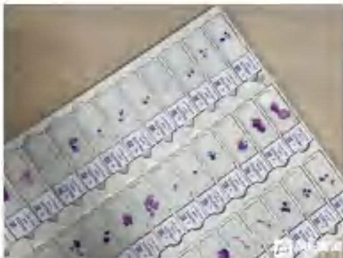
每一份送检的切片上，都寄托着患者及家属的等待和期望

在匆忙的病理科医生急忙冲出门，看到刚才那位家属神色痛苦，正趴在地板上，用头猛烈地撞击地板。医生第一时间跑到该男子身前将其扶起，耐心劝解。“我们告诉你，这个病可以通过服用靶向药来进行治疗，会得到好转。”经过医生们的开导，男子的情绪才能好转。“看他没事了我们才放心，有时候患者及家属的这种情绪，真的需要医生的一个援助。”